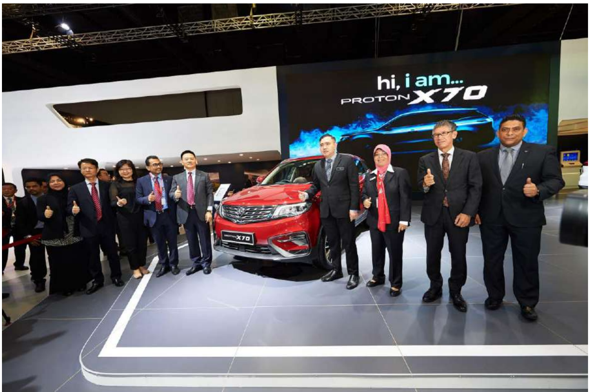
Minister Tour at Proton Booth