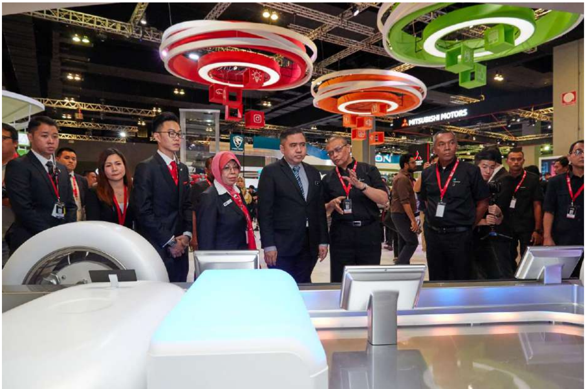
KLIMS'18 Minister Tour