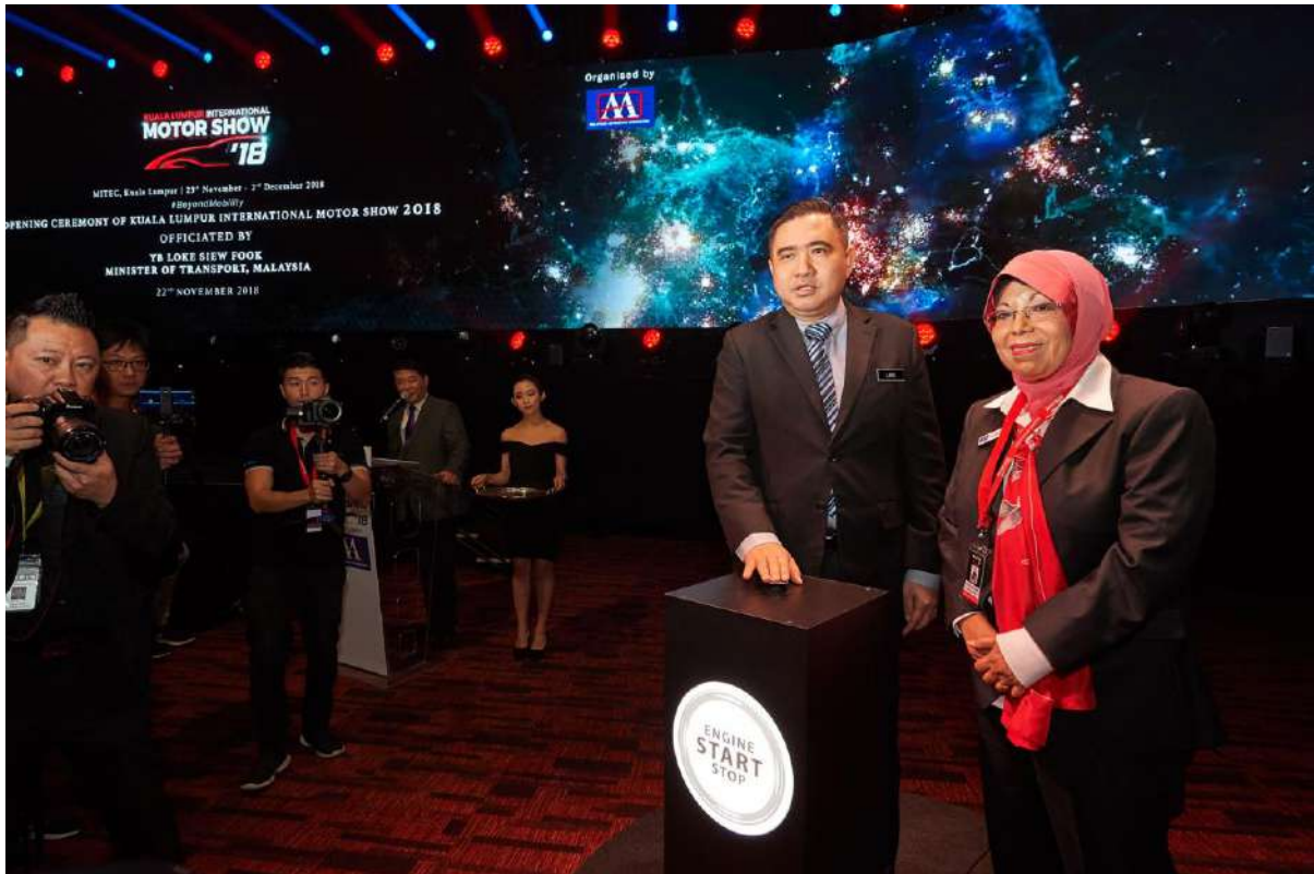
YB Loke Siew Fook and Datuk Aishah Ahmad at KLIMS'18 Opening Ceremony