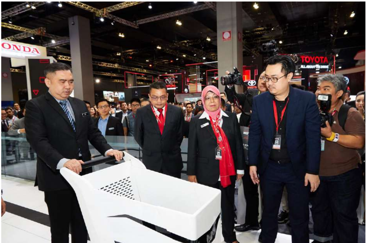
Minister Tour at Honda Booth

Please download high-resolution photo on: