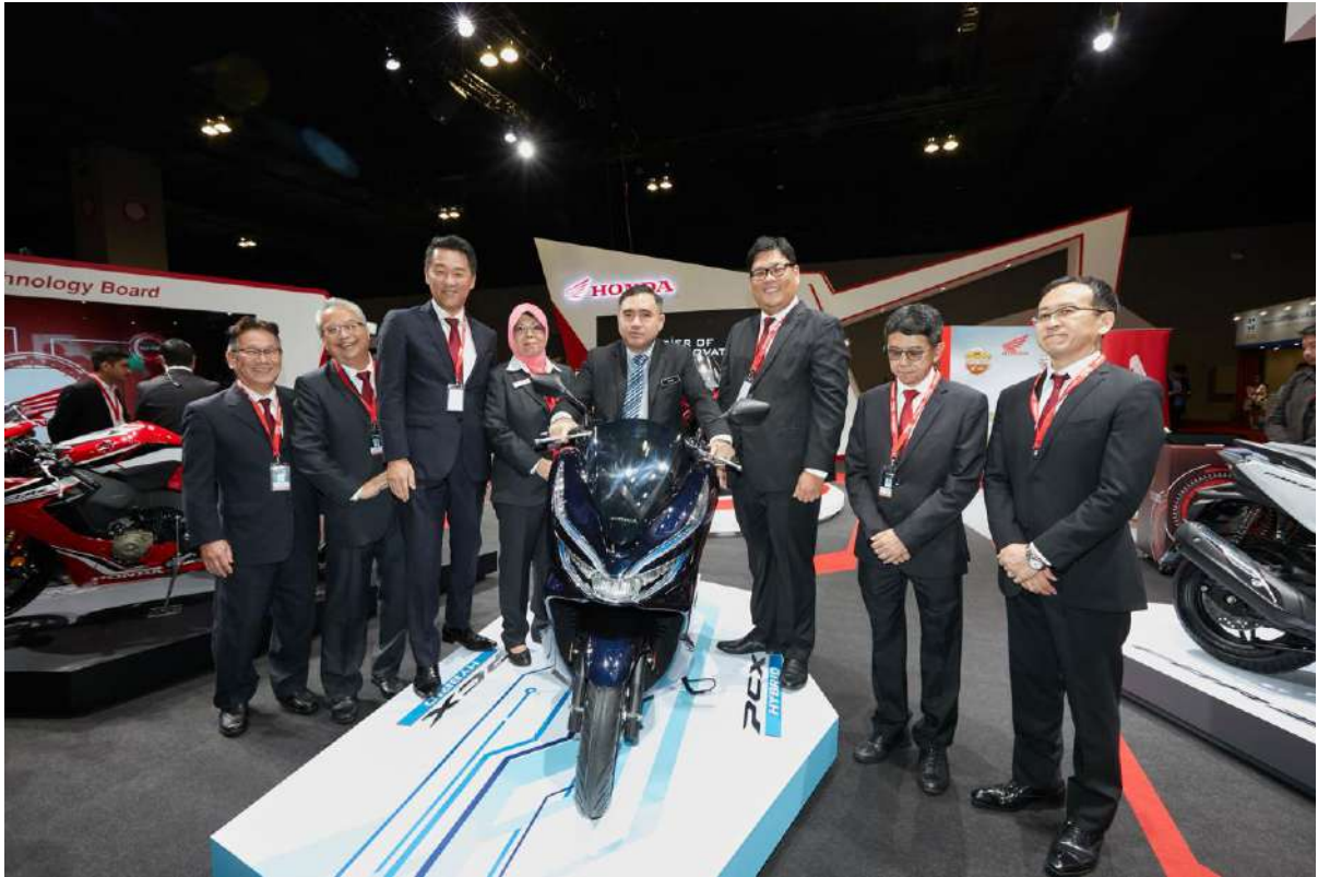
Minister Tour at Boon Siew Honda Booth