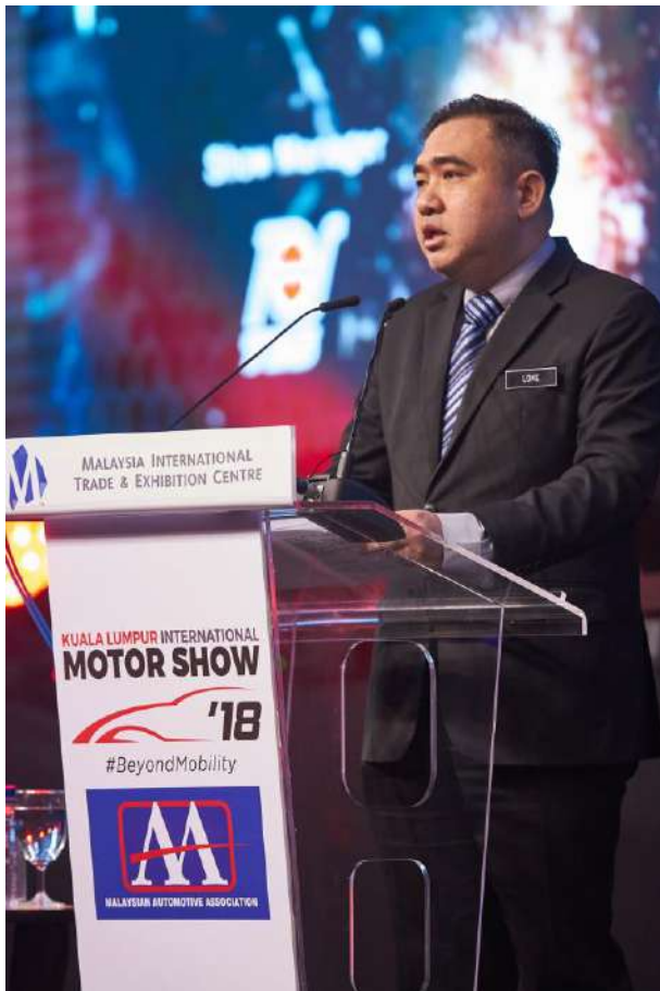
Speech by YB Loke Siew Fook at KLIMS'18 Opening Ceremony