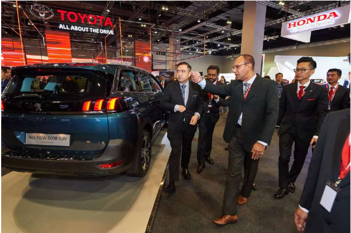
Minister Tour at Honda Booth