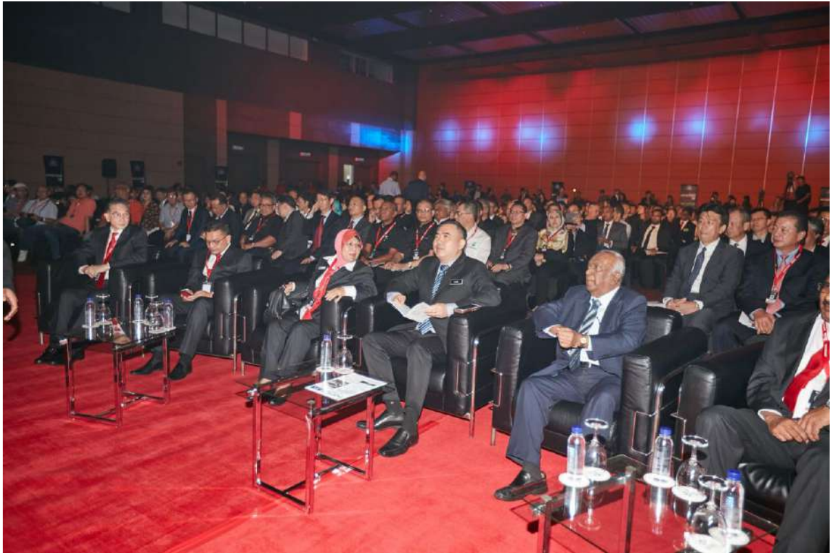
KLIMS'18 Opening Ceremony