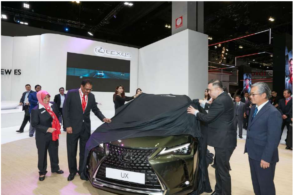
Minister Tour at Lexus Booth